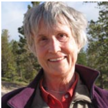
Donna Haraway (Colorado, 1944)

détient la chaire d'histoire de la conscience à l'université de Californie à Santa Cruz. Elle est l'auteure de plusieurs livres sur la biologie et le féminisme. Elle est l'une des pionnières du cyberféminisme. Elle est surtout connue pour son essai qui a marqué les premières heures du cyberféminisme Manifeste cyborg: science technologie et féminisme socialiste à la fin du xx e siècle . Haraway montre à travers cette métaphore que des choses qui semblent naturelles, comme le corps humain, ne le sont pas: elles sont construites par nos idées sur elles.