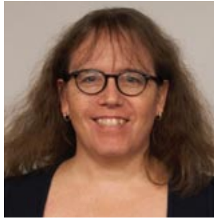
Julia Serano (USA, 1959)

est un philosophe. Il théorise l'abolition des différences entre les sexes, les genres et les sexualités et questionne les nouvelles technologies du corps que sont les hormones, la chirurgie plastique ainsi que leurs usages médicaux disciplinaires comme la réassignation d'un sexe aux intersexuel-le-s et leur potentiel de subversion du système de genre par de nouveaux codages corporels. En août 2014, Beatriz Preciado se dit « trans in between non opéré », puis décide en janvier 2015 d'utiliser le nom de Paul B. Preciado et choisit le masculin pour s'identifier. Il obtient un changement d'état civil en novembre 2016.