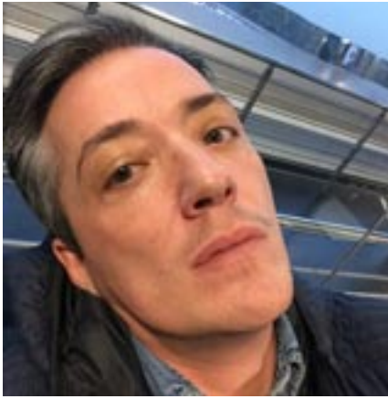
Paul B. Preciado (Espagne, 1970)

est un philosophe. Il théorise l'abolition des différences entre les sexes, les genres et les sexualités et questionne les nouvelles technologies du corps que sont les hormones, la chirurgie plastique ainsi que leurs usages médicaux disciplinaires comme la réassignation d'un sexe aux intersexuel-le-s et leur potentiel de subversion du système de genre par de nouveaux codages corporels. En août 2014, Beatriz Preciado se dit « trans in between non opéré », puis décide en janvier 2015 d'utiliser le nom de Paul B. Preciado et choisit le masculin pour s'identifier. Il obtient un changement d'état civil en novembre 2016.