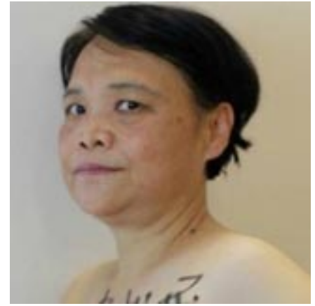
Ai Xiaoming (Chine, 1953)