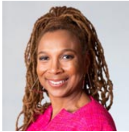
Kimberlé Williams Crenshaw (USA, 1959)

est une théoricienne féministe postcoloniale. Elle plaide pour l'inclusion d'une approche transnationale pour analyser les expériences des femmes, la praxis féministe anticapitaliste, l'éducation antiraciste et la politique de la connaissance. Elle prône une solidarité non colonialiste des féministes dépassant les frontières à travers une analyse intersectionnelle de la race, de la nation, du colonialisme, de la sexualité, la classe et le sexe.