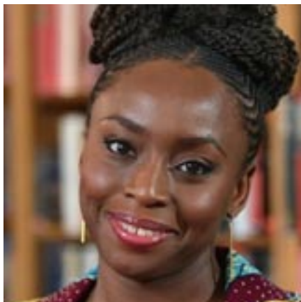
Chimamanda Ngozi Adichie Nigeria, (1977)

est une écrivaine de renommée mondiale, égérie féministe dont le discours Nous sommes tous des féministes , diffusé sur Youtube et samplée par Beyoncé, fit événement. Ce texte évoque l'influence qu'ont les histoires et les approches narratives dans les mécanismes de domination culturelle, sociale, raciale, économique et politique, si ces histoires sont univoques ou ne proviennent que d'une seule partie de la société ou du monde, résonnant ainsi comme une « histoire unique ».