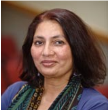
Chandra Talpade Mohanty (Inde, 1955)

est une théoricienne féministe postcoloniale. Elle plaide pour l'inclusion d'une approche transnationale pour analyser les expériences des femmes, la praxis féministe anticapitaliste, l'éducation antiraciste et la politique de la connaissance. Elle prône une solidarité non colonialiste des féministes dépassant les frontières à travers une analyse intersectionnelle de la race, de la nation, du colonialisme, de la sexualité, la classe et le sexe.