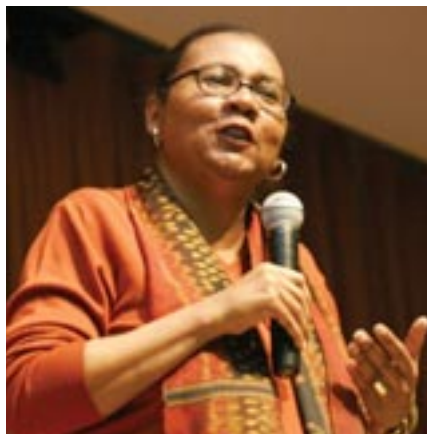
Bell Hooks (USA, 1952)

détient la chaire d'histoire de la conscience à l'université de Californie à Santa Cruz. Elle est l'auteure de plusieurs livres sur la biologie et le féminisme. Elle est l'une des pionnières du cyberféminisme. Elle est surtout connue pour son essai qui a marqué les premières heures du cyberféminisme Manifeste cyborg: science technologie et féminisme socialiste à la fin du xx e siècle . Haraway montre à travers cette métaphore que des choses qui semblent naturelles, comme le corps humain, ne le sont pas: elles sont construites par nos idées sur elles.