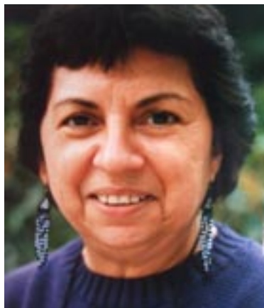
Gloria Anzaldúa (Nouveau Mexique, 1942-2004)

Dans Chère Ijeawele , son dernier livre publié en 2017, elle propose un manuel d'éducation féministe en quinze points et suggère que cette éducation soit donnée dès le plus jeune âge.