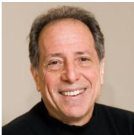
Michael Kimmel (USA, 1951)

est un sociologue américain spécialisé dans les études de genre. Il occupe le poste de professeur distingué de sociologie à l'Université Stony Brook de New York et est le fondateur et rédacteur en chef de la revue académique Men and Masculinities . Kimmel est un porte-parole de l'organisation nationale pour des hommes contre le sexisme (NOMAS) et un féministe de longue date. En 2013, il a fondé le Centre pour l'étude des hommes et des masculinités à l'Université Stony Brook, où il est directeur exécutif.