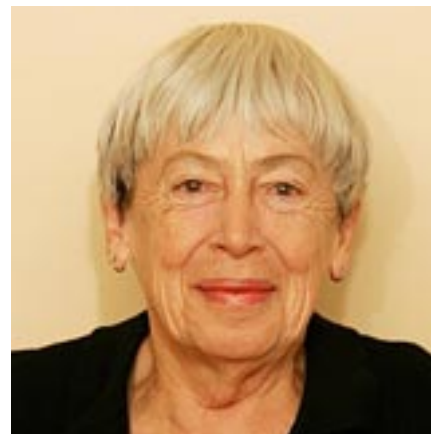
Ursula K. Le Guin (USA, 1929-2018)

est une écrivaine américaine de science-fiction et de fantasy . Elle écrit des romans, des nouvelles, des poèmes, des livres pour enfants et des essais. Elle est surtout connue à partir des années 1960 pour ses nouvelles et romans de fantasy et de science-fiction dans lesquels elle se distingue par son exploration des thèmes anarchistes, taoïstes, féministes, ethnologiques, psychologiques ou sociologiques. Sa science-fiction n'est pas tournée vers la technique: la plupart de ses écrits se distinguent par l'importance qu'ils accordent aux sciences sociales comme la sociologie ou l'anthropologie. Ses œuvres délivrent souvent un message sur notre époque par le biais des cultures extraterrestres inhabituelles qu'elle invente. Elle est une grande source d'inspiration pour les théoriciennes féministes dont Donna Haraway.