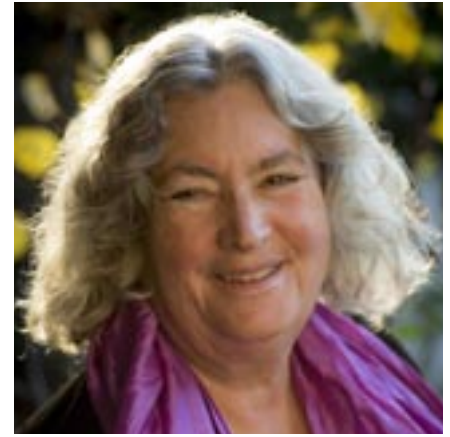
Starhawk (Californie, 1951)

est une, écrivaine, militante trans-bi et biologiste américaine. Julia Serano vit actuellement à Oakland, en Californie et est auteure de Whipping Girl: A Transsexual Woman on Sexism and the Scapegoating of Femininity . Sur la base de ses connaissances sur le genre, Serano a été invitée à parler du transgendérisme et des problèmes des femmes trans dans de nombreuses universités. Ses écrits ont également été utilisés dans des matériaux d'enseignement de cours d'études de genre aux États-Unis. Elle a inventé plusieurs termes qui sont maintenant utilisés dans les études de genre tels que « appropriation cissexuelle », « sexisme oppositional » et « effémimania ».