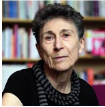
Silvia Federici (Italie, 1942)

Son premier livre Foulards et hymens - Pourquoi le Moyen-Orient doit faire sa révolution sexuelle ? a été publié en 2015. Elle y dénonce, un mélange toxique de culture et de religion et en particulier la diffusion de son interprétation ultra-conservatrice venue d'Arabie Saoudite.