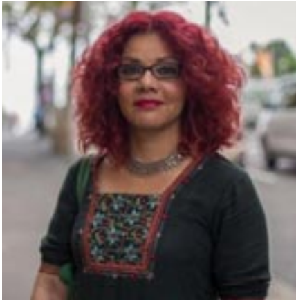
Mona Eltahawy (Égypte, 1967)

est une journaliste, écrivaine, militante féministe, activiste basée au Caire et à New York. Elle a acquis la citoyenneté américaine après avoir été violée place Tahrir alors qu'elle couvrait les événements de la révolution égyptienne.