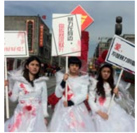
Feminist Five (Chine)

Dans Caliban et la sorcière : Femmes, corps et accumulation primitive , elle met en parallèle l'asservissement méthodique des femmes et de l'appropriation de leur travail, l'institutionnalisation du viol et de la prostitution, ainsi que les procès des hérétiques et les chasses aux sorcières, les bûchers, et la torture avec l'esclavage et le massacre des populations indigènes du continent américain.