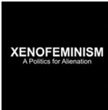
Laboria Cuboniks (France)

est une anagramme du pseudonyme Nicolas Bourbaki, un mathématicien imaginaire créé par un groupe de mathématiciens formé en 1935 à Besse (France), et désigne un collectif composé de six femmes qui ont créé une théorie: le xénoféminisme décrit comme une forme de féminisme technomatérialiste, anti-naturaliste, qui prône l'abolition du genre. Les xénoféministes discutent de la façon dont on pourrait changer les objectifs des technologies existantes pour les rendre plus utiles à la société et, surtout, pour qu'elles ne puissent pas être utilisées comme un outil de discrimination sexuelle. Le xénoféminisme est aussi anti-naturaliste dans le sens où il conteste le déterminisme naturel dans le contexte politique.